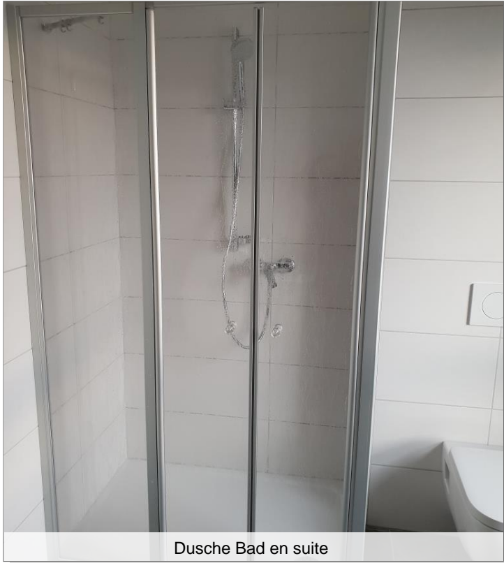
Dusche Bad en suite