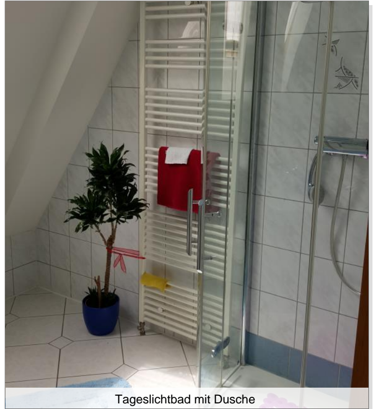
Tageslichtbad mit Dusche