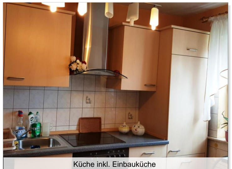
Küche inkl. Einbauküche