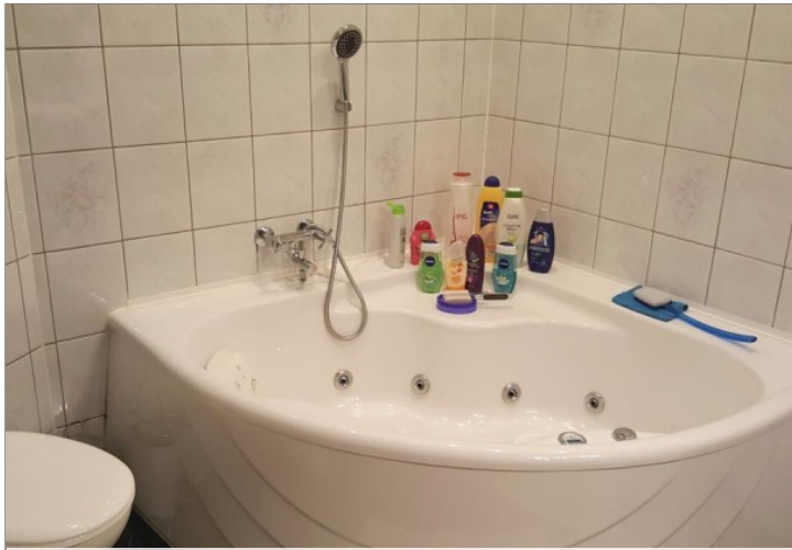
Bad mit Whirlpoolwanne