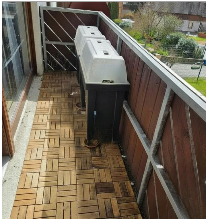
Balkon am Wohnzimmer