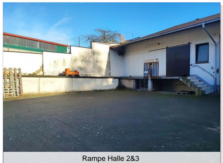
Rampe Halle 2&3