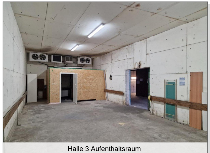
Halle 3 Aufenthaltsraum