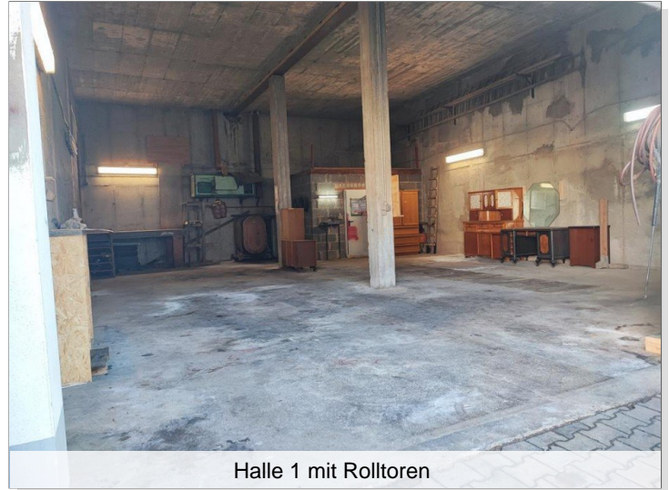
Halle 1 mit Rolltoren