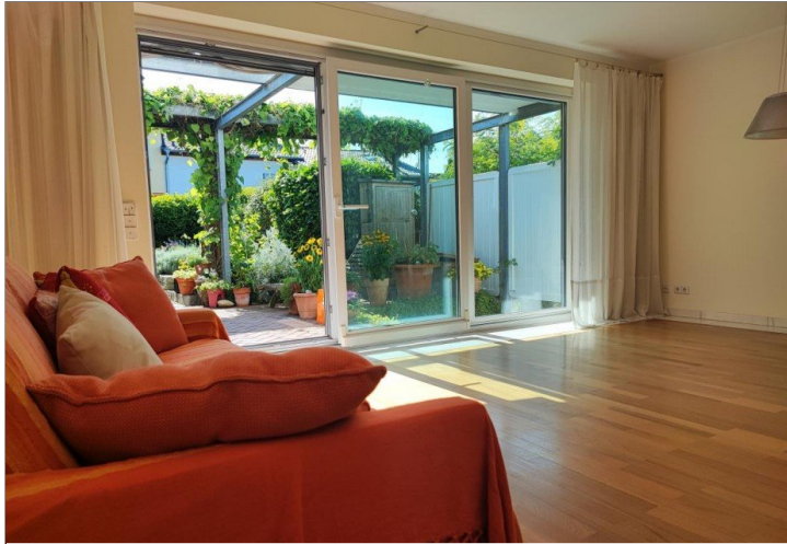
Blick in Garten