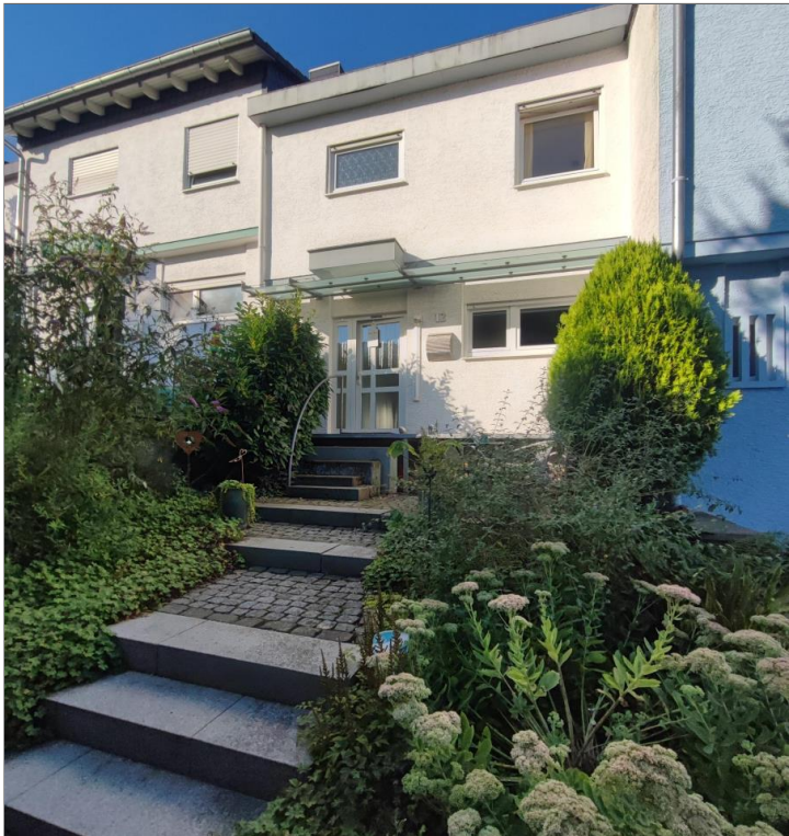
Außenansicht | Vorgarten