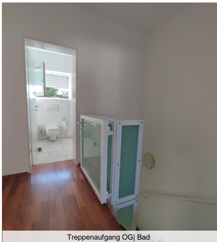
Treppenaufgang OG| Bad