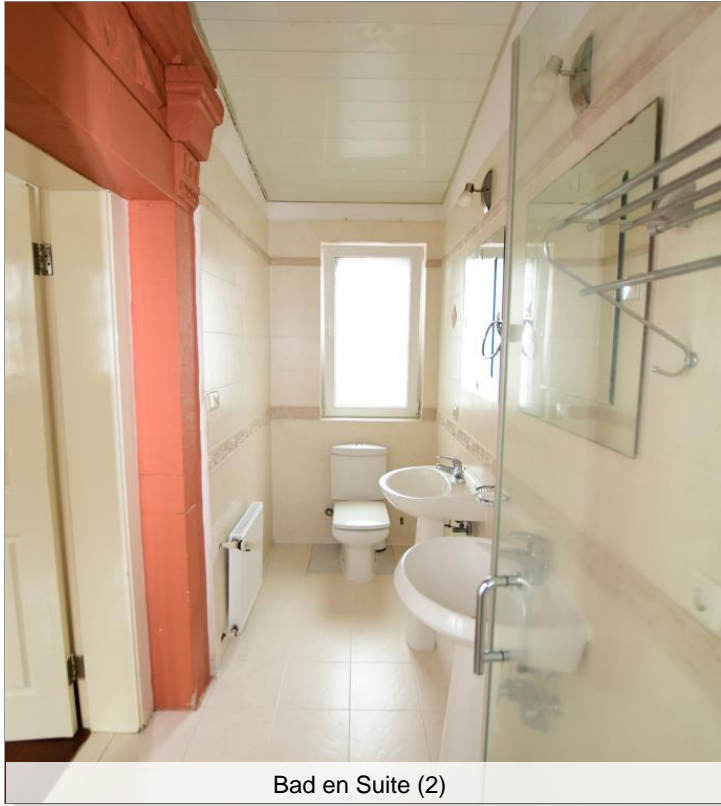
Bad en Suite (2)