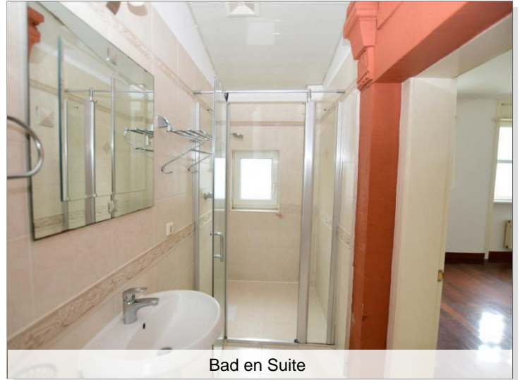
Bad en Suite