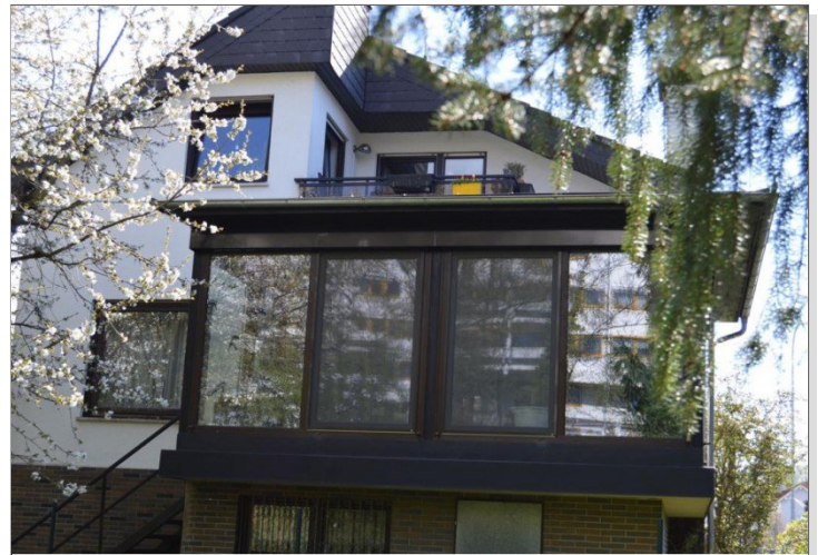
Ansicht Haus und Wintergarten